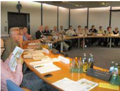
Round Table meeting in 2010 (Urban Planning Office)

Drezdene, Vokietijoje, plėtros procesas dėl „Transporto plėtros planas 2025plus“ (TPP) prasidėjo 2009 m. rudenį. Nuo pat pradžių „Apvalusis Stalas“ buvo pagrindinis komitetas planavimo procese. Moderuojamas nepriklausomo planavimo biuro, jis susidėjo iš 46 organizacijų atstovų, profesinių asociacijų, kontorų, šalininkų, miestų administracijos ir visų miesto tarybos atstovų. Buvo sudarytos 4 dirbančios grupės, pagal panašaus pobūdžio apvaliojo stalo narių idėjas ir požiūrį: