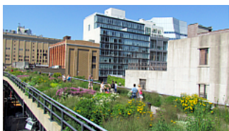
High Line park NYC – Manhattan 2011

El financiamiento colectivo tiene el potencial de desbloquear el acceso a barreras financieras, y ayudar a las comunidades a unirse para invertir en sus propios espacios y lugares, o para mejorar el ambiente donde viven. Esto a menudo es llamado financiamiento colectivo cívico. Algunos buenos ejemplos incluyen: